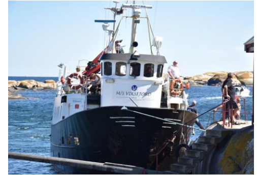
[M/S Viksfjord har plass til 70 ]